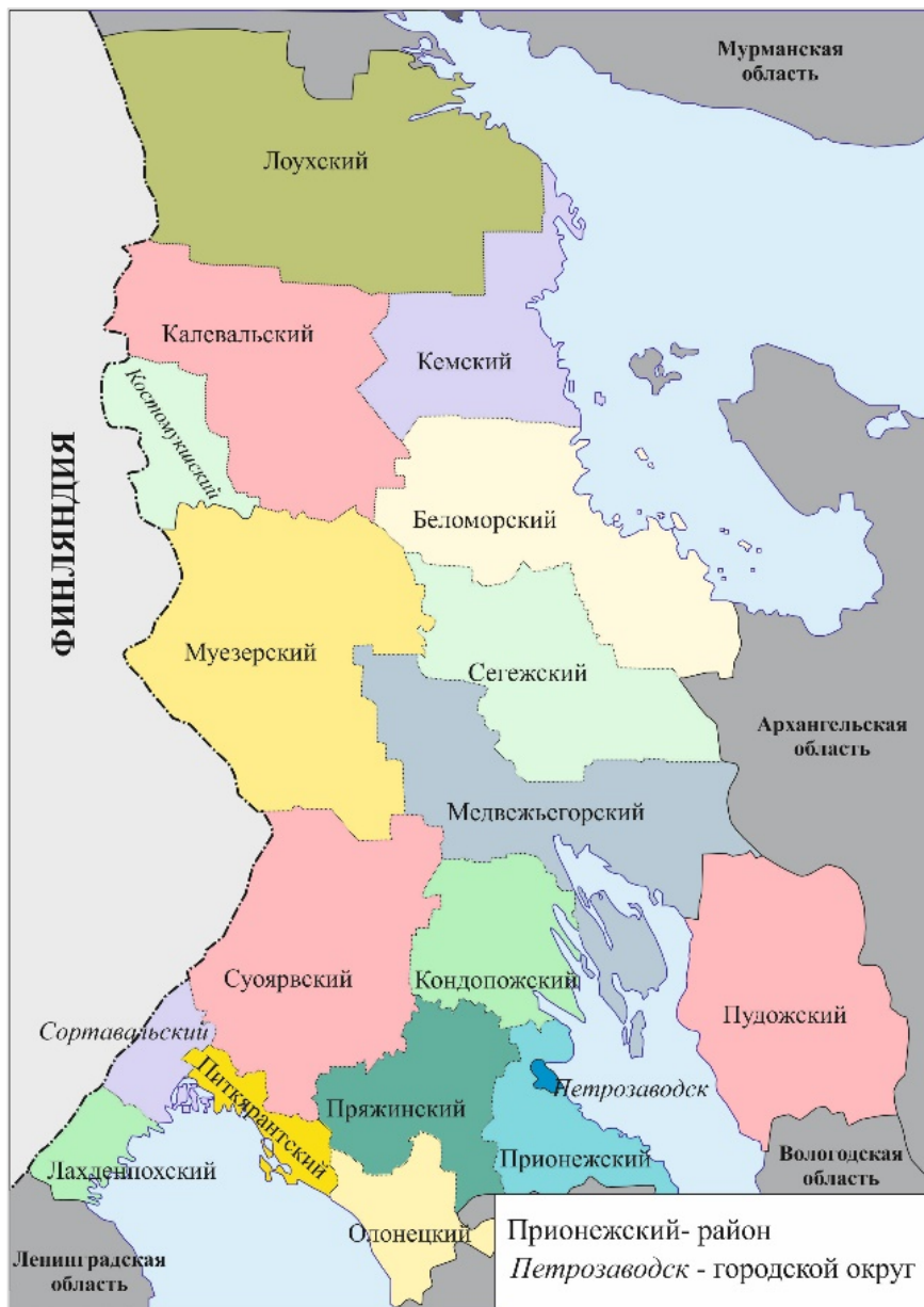
Рис. 1. Административно-территориальное устройство Республики Карелия

дит более интенсивными темпами, чем в среднем по региону, составляя соответственно -25,5 и -19,8\% за 2009—2018 годы. Наиболее остро проблема выражена в Лоухском, Муезерском и Калевальском национальных муниципальных районах ( -30\% ). Некоторое исключение составляют Костомукшский городской округ и Сортавальский район, где темпы спада ниже, что обусловлено в отличие от других приграничных муниципалитетов более широкими возможностями трудоустройства.