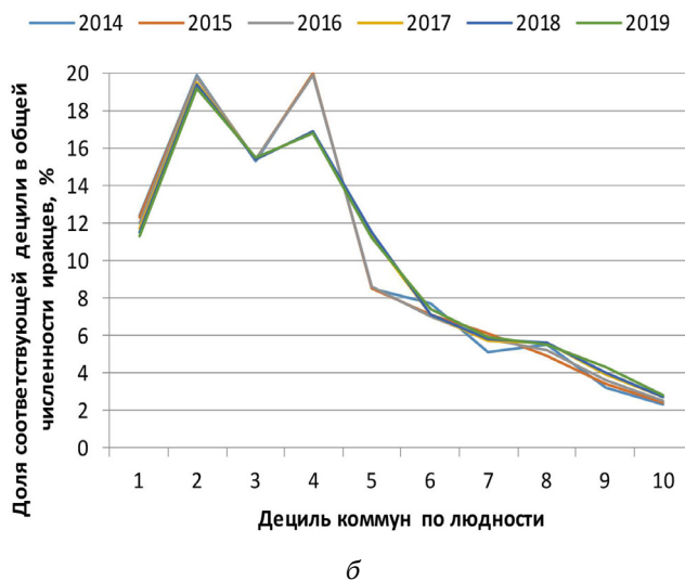
Рис. 2. Распределение сирийцев (а) и иракцев (б) по децилям коммун Швеции в 2014—2019 гг.

Размещение иракцев по децилям коммун к началу кризиса характеризовалось еще большей, чем у сирийцев, концентрацией в крупных коммунах. Однако само их распределение в период 2014—2019 гг. было более равномерным (при незначительном росте в этот период малых коммун), что связано с относительно незначительным числом приехавших мигрантов из Ирака в период кризиса по сравнению с таковым в 2000-х гг. Значительный рост числа иракцев в средних по численности коммунах (5-й дециль) в 2016—2017 гг. объясняется переходом в эту группу некоторых коммун 4-го дециля. Таким образом, перераспределение иракцев в пределах Швеции в период миграционного кризиса во многом было обусловлено траекторией, сформированной еще до его начала.