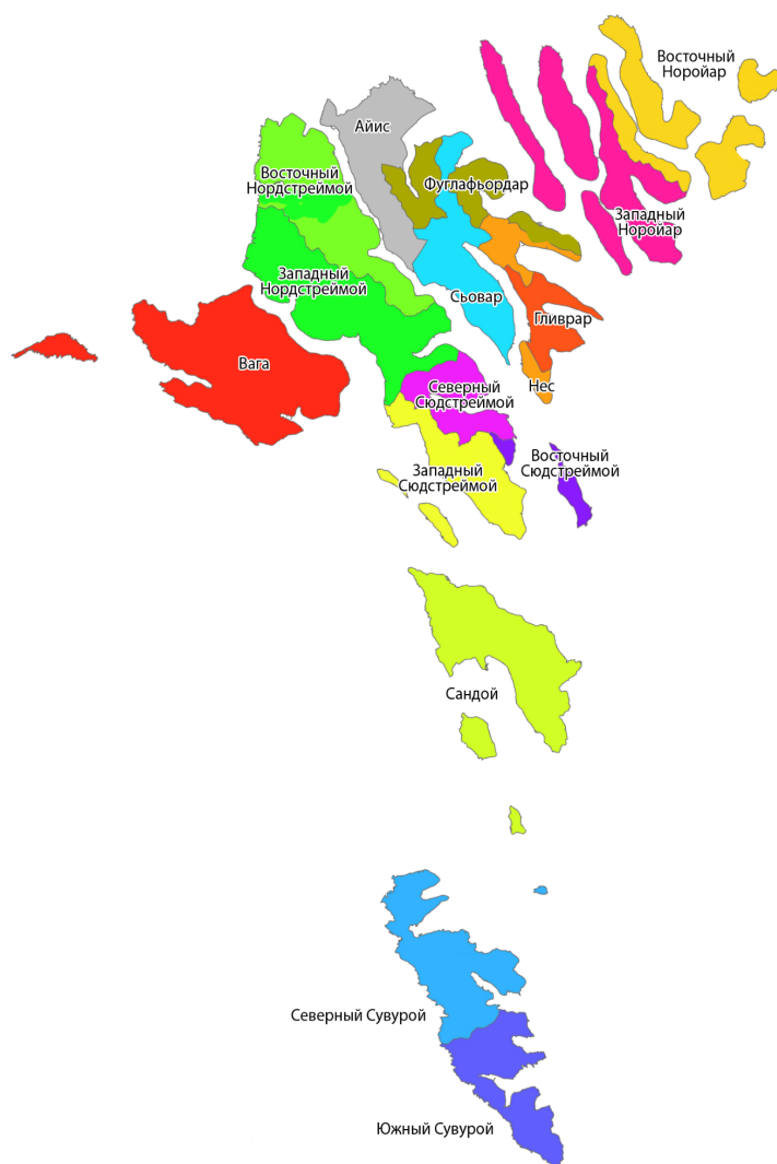
Рис. 2. Территориальное деление Церкви Фарерских островов

Учет количества храмов, адептов и представителей духовенства официально ведется Статистической службой Фарерских островов, сведения которой фиксируют сокращение числа прихожан. Их доля составляет 78 % от численности населения архипелага при количественном росте объектов культово-культурной инфраструктуры и представителей духовенства. Объем имеющейся в открытом доступе информации не так полон, как предоставляемый ЕЛЦД, но он дает возможность получить расчетные данные коэффициента территориальной концентрации диоцезов и храмов Церкви Фарерских островов. Результативное значение (для каждого из объектов 0,144 и 0,132 соответственно) подтверждает, что они размещены по территории региона с высокой степенью равномерности. Особую важность это обстоятельство обретает при принятии во внимание физико-географического положения островов и отсутствия соединяющей их системы транспортных коммуникаций. Но нужно учитывать и специфику размещения населения архипелага. Если допустить отсут-