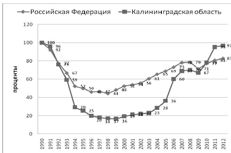
Рис. 1. Динамика промышленного производства к 1990 г., %

К концу 1980-х гг. уровень экономического развития региона примерно соответствовал среднему по Российской Федерации: промышленной продукции в расчете на душу населения производилось примерно на 10% меньше, а сельскохозяйственной — на 10% больше [16, с. 28]. Распад СССР и превращение Калининградской области в эксклав Российской Федерации усилили негативное влияние на экономику региона общего для страны кризиса 1990-х гг. Спад промышленного и сельскохозяйственного производства оказался более глубоким, чем в РФ в целом (рис. 1, 2).