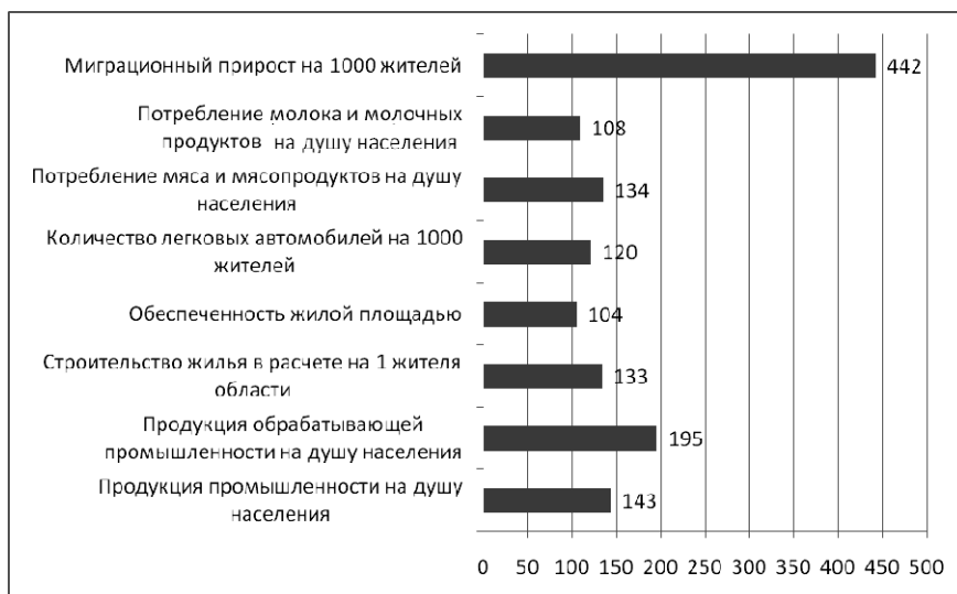
Рис. 5. Показатели социально-экономического развития Калининградской области, превосходящие средние по РФ, в 2012 г. (РФ = 100)