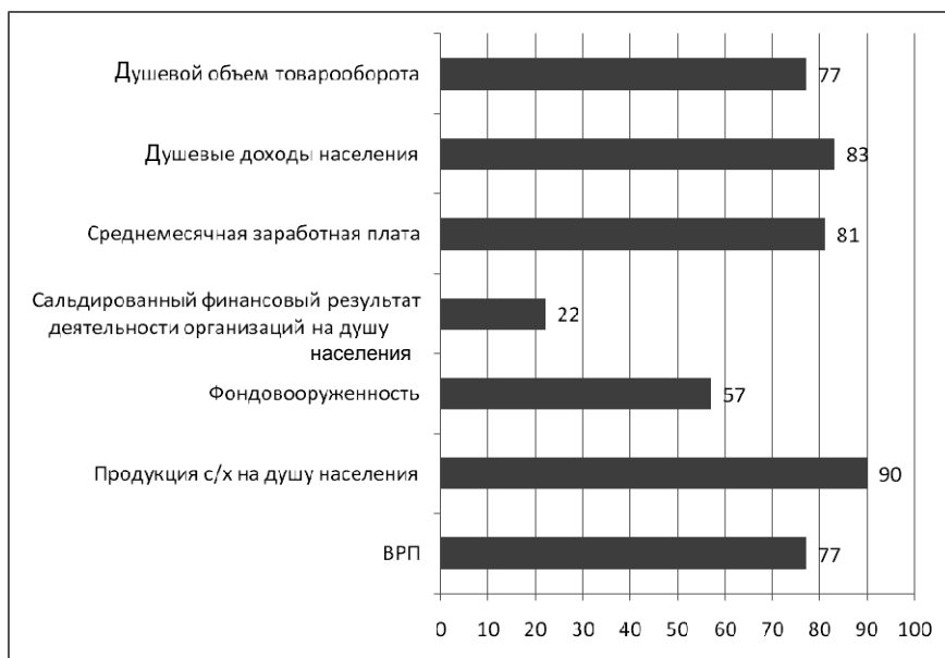
Рис. 4. Показатели социально-экономического развития Калининградской области, уступающие средним по РФ, в 2012 г. (ВРП — 2011 г., РФ = 100)